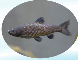
ウシモツゴ