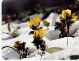
フクジュソウ