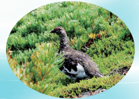
ライチョウ