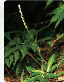
ミノシライトソウ