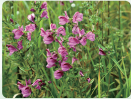
ミカワシオガマ