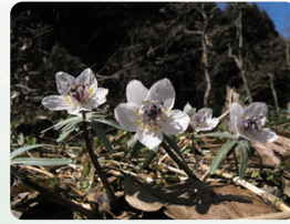
セツブンソウ