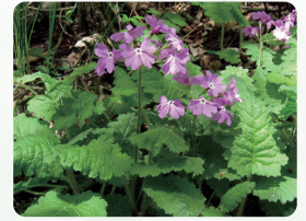
サクラソウ