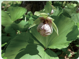
クマガイソウ