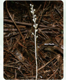
サクラインソウ