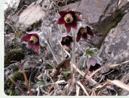
オキナグサ