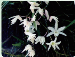
セツコク