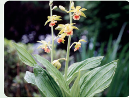
サルメンエビネ