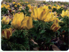
ミチノクフクジュソウ