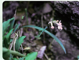
ウチョウラン