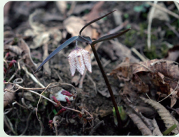
ミノコバイモ