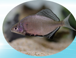
イタセンパラ